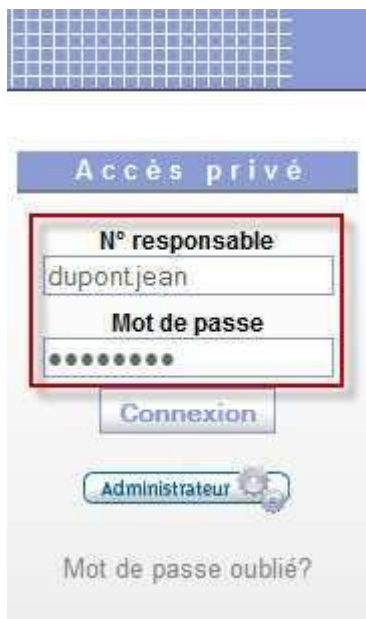
Fenêtre de connexion au portail des parents